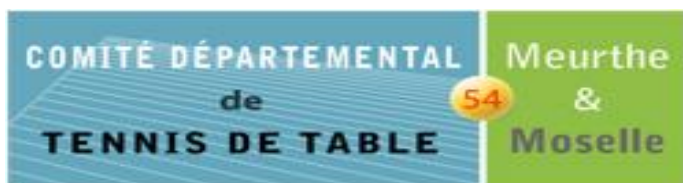
Tableau Final JEUNES du 07/05/2011