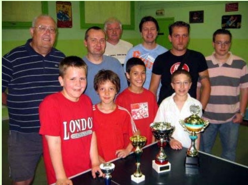
Les pongistes de l'US Jarny ont réussi une belle performance à Pont-à-Mousson